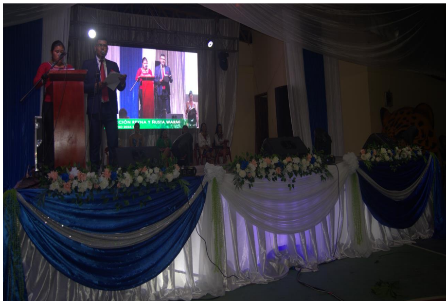
Fotografía N° 06. ARREGLO DE ESCENARIO