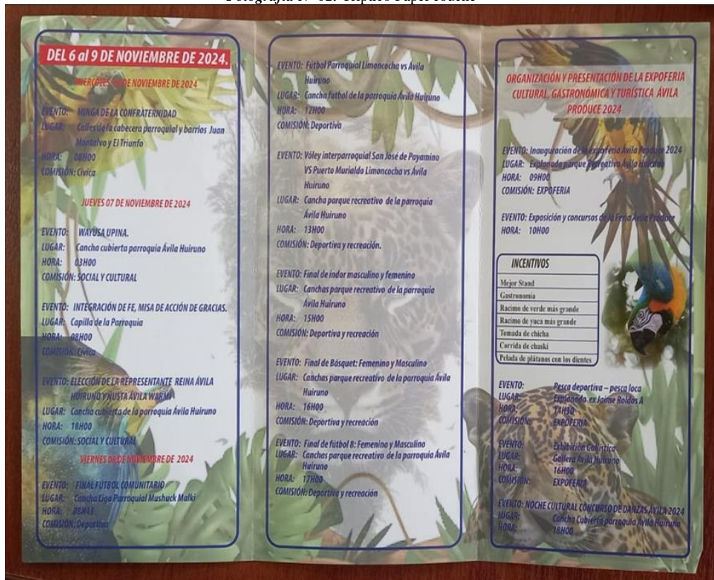
Fotografía N° 02. Tríptico Papel couché