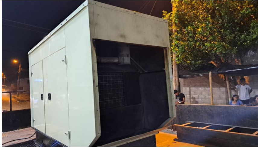
Fotografía N° 37. Generador Eléctrico

A fin de evitar inconvenientes ante un posible fallo en el fluido eléctrico, se dispuso de un generador eléctrico y el técnico operador para su funcionamiento, quien estuvo a cargo de solventar las necesidades de alimentación eléctrica a los equipos que estuvieron en funcionamiento durante el desarrollo.