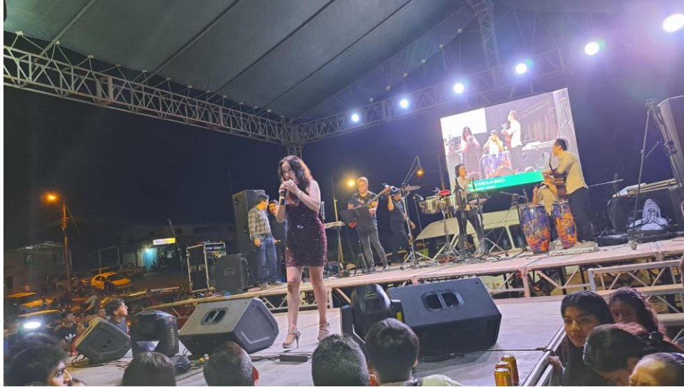
Fotografía N° 39. Artista Cultural De Música Renombre Nacional.

Se realiza la presentación de una artista de renombre Nacional CECILIA NARVÁEZ MONTENEGRO, conocida en el mundo artístico con el seudónimo de “CECY NARVÁEZ”, el cual realiza una presentación de 2 horas, para la ejecución del evento.