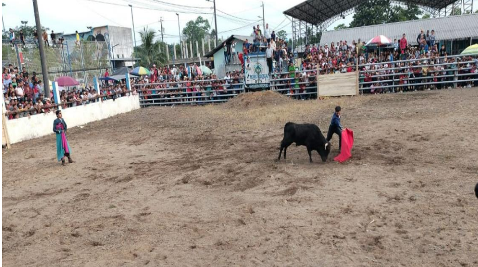
Fotografía N° 33. Feria taurina y toros de pueblo

Para la ejecución se brindó el servicio de Puesta en escena un show de TOROS DE PUEBLO, PARA LA DIFUSIÓN Y FOMENTAR LA CULTURA TRADICIONAL DEL ECUADOR