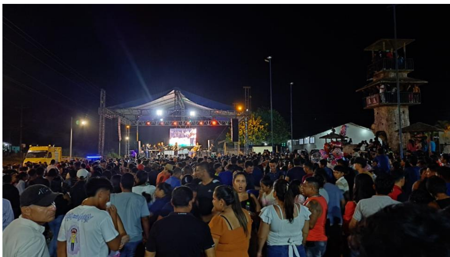
Fotografía N° 36. Amplificación, Sonido, Pantalla, Luces, Rider Técnico.

Para la ejecución del evento se brindó el servicio de amplificación, sonido, pantalla led, luces, rider técnico para ello se empleó todo lo necesario los mismos que se distribuyeron según correspondía y que fueron puestas a disposición de las autoridades y artistas.