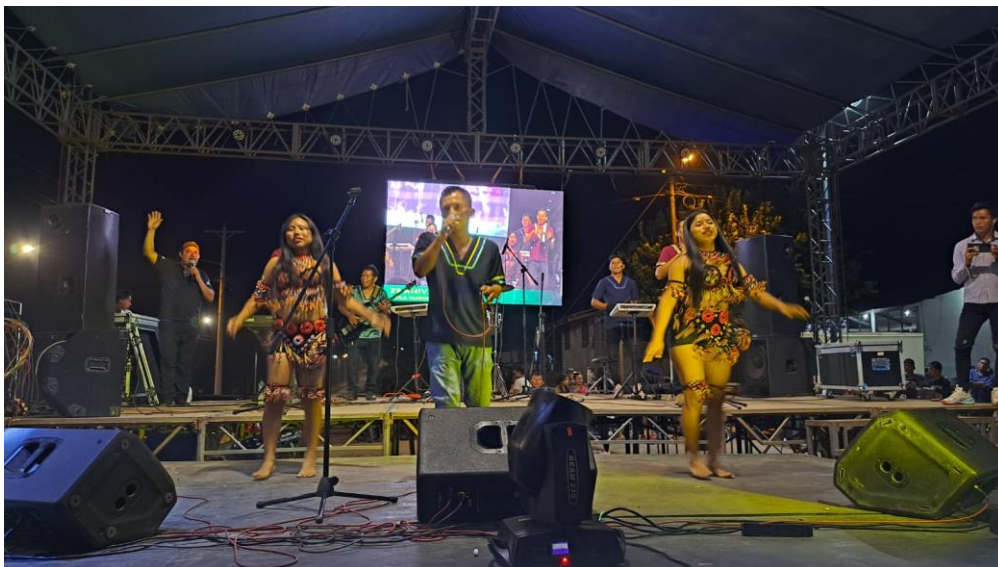
Fotografía N° 26. Artista Cultural De Música Renombre Local.

Se realiza la presentación de una artista de renombre Local “LOS AUTÉNTICOS DE LA AMAZONIA” el cual realiza una presentación de 1 hora y 30 minutos, para la ejecución del evento”