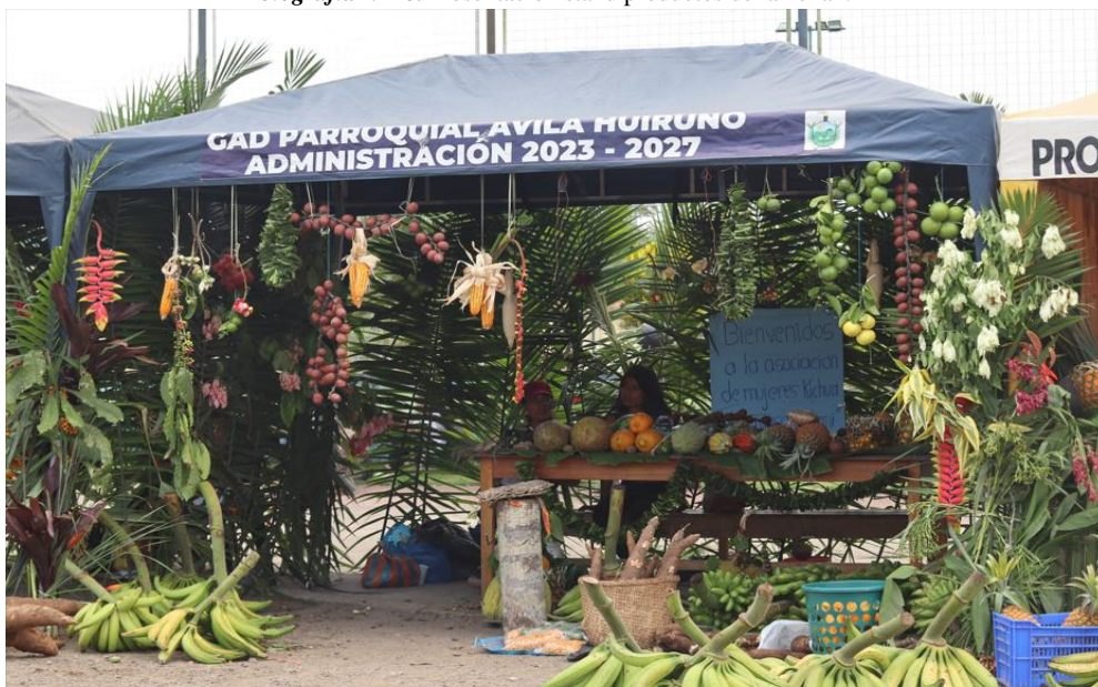
Fotografía N° 18. Presentación stand productos de la zona1.

Se realiza la presentación de los Stands como demostración de la cultura de la nacionalidad Kichwa de la amazonia como es Ávila Huiruno, para la ejecución del evento