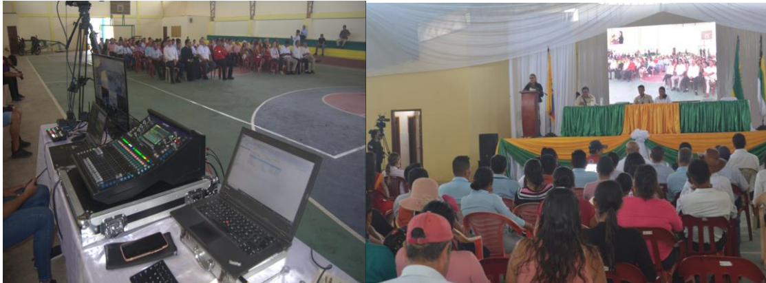
Fotografía N° 32. ESCENARIO CON PANTALLA PARA VISUALIZACIÓN DE IMÁGENES Y VIDEOS.

Se brindó el servicio de escenario con pantalla para visualización de imágenes y videos y que fueron puestas a disposición de las autoridades e invitados para su estancia durante el desarrollo de los diferentes eventos contemplados dentro del proyecto.