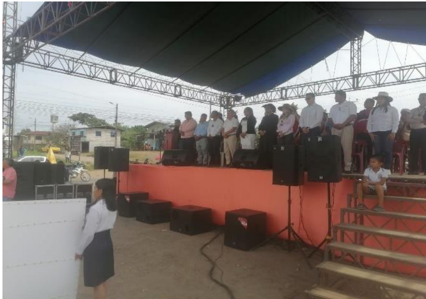
Fotografía N° 27. AMPLIFICACIÓN Y SONIDO PARA EL EVENTO DE DESFILE CÍVICO.

Se verifica el cumplimiento de acuerdo a las características del servicio.