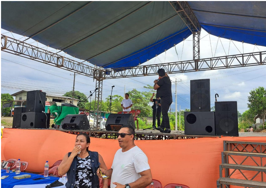
Fotografía N° 14. Amplificación y sonido para el evento de la expo feria

se empleó todo lo necesario los mismos que se distribuyeron según correspondía y que fueron puestas a disposición de las autoridades e invitados para su estancia durante el desarrollo de los diferentes eventos contemplados dentro del proyecto.