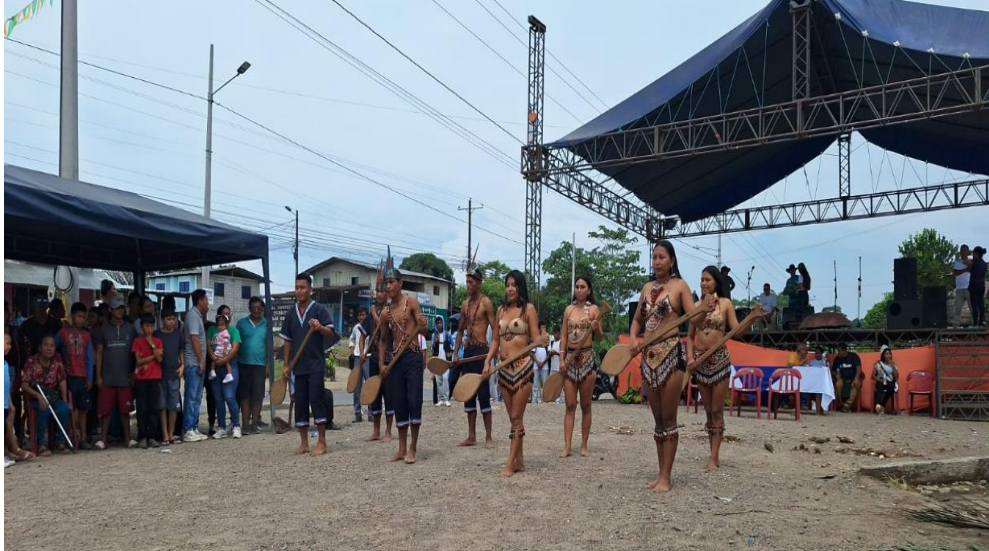
Fotografía N° 17. Danza tradicional.

Se realiza la presentación de una Danza tradicional AMAUTA TUSHUY el cual realiza una presentación de 15 minutos, en dos salidas para la ejecución del evento