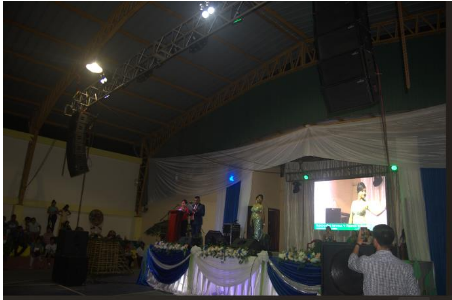
Fotografía N° 04. AMPLIFICACIÓN, SONIDO, PANTALLA LED, INCLUYE LOGÍSTICA Y PERSONAL.