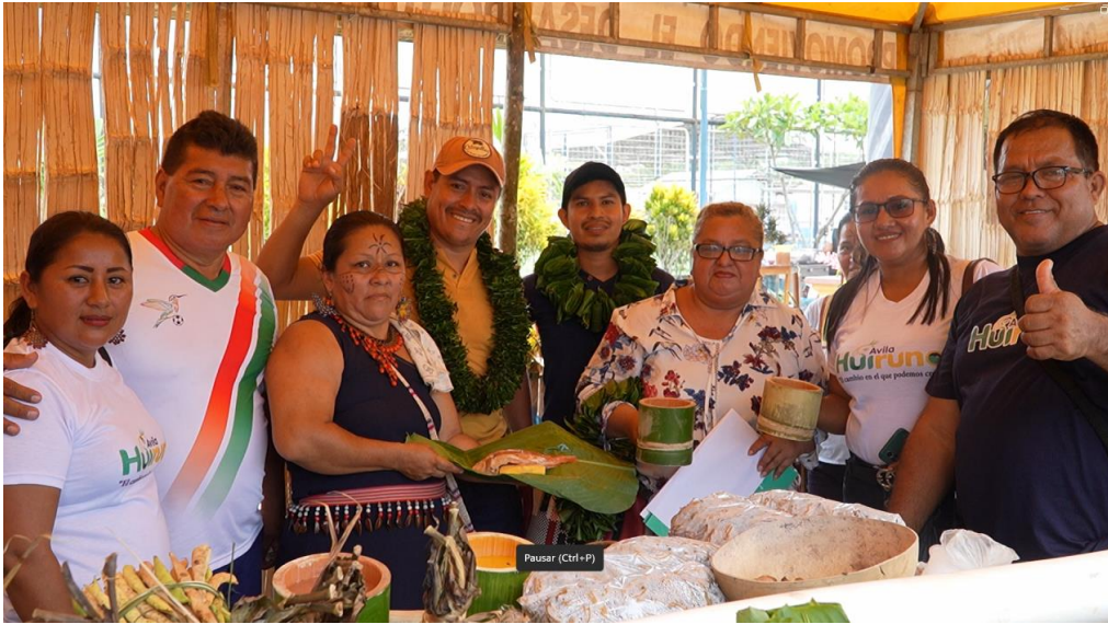
Fotografía N° 20. PRESENTACIÓN STAND ARTESANIAS TÍPICAS